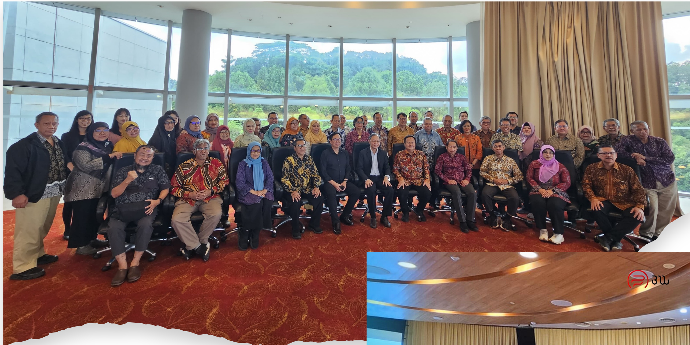
Benchmarking SAUI di National University Singapore