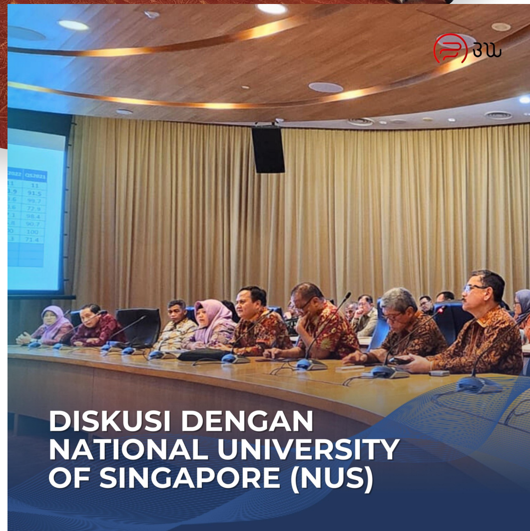
DISKUSI DENGAN NATIONAL UNIVERSITY OF SINGAPORE (NUS)