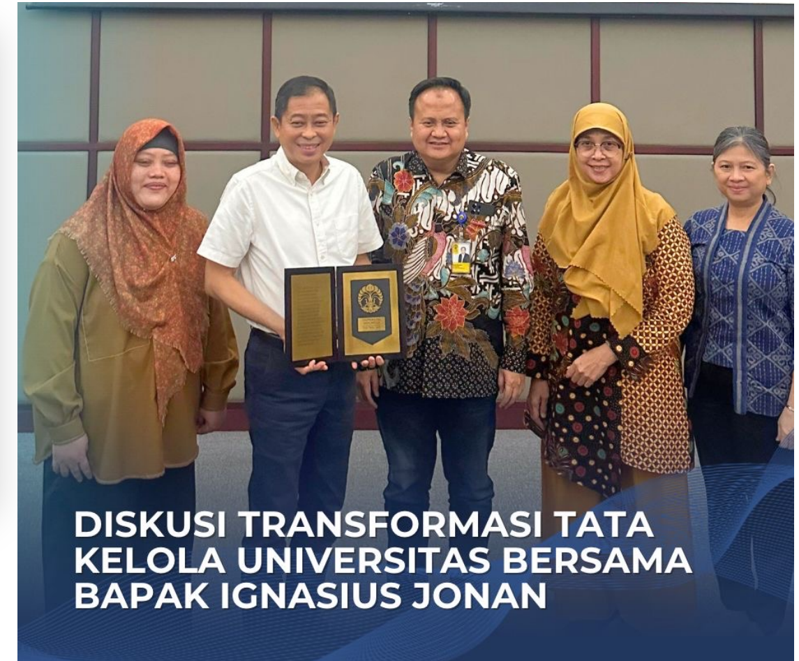
DISKUSI TRANSFORMASI TATA KELOLA UNIVERSITAS BERSAMA BAPAK IGNASIUS JONAN